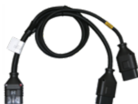
CAVO DI PROLUNGA PER SENSORI MX