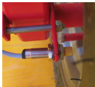
CAVO SEGNALE A 7 POLI 1