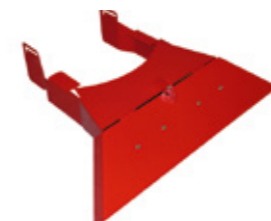
AMPLIAMENTO MODULARE DEL- LA MACCHINA