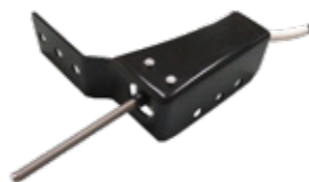
SENSORE DISPOSITIVO DI SOLLEVAMENTO CARRELLO (KIT ACCESSORI)